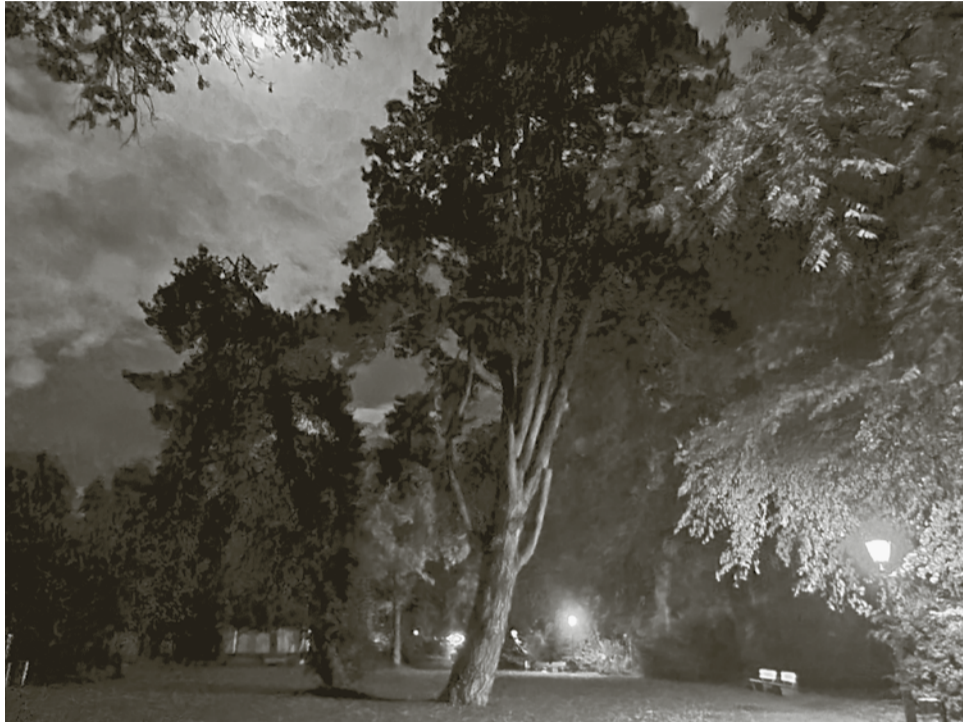
Partielle Mondfinsternis im BFS-Park