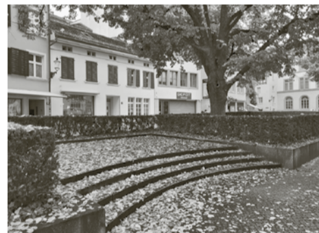
Herbststimmung auf dem Kirchplatz