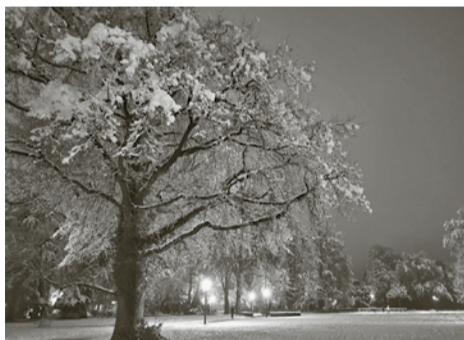
Schnee im Stadtpark