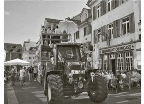
Techumzug an der Obergasse