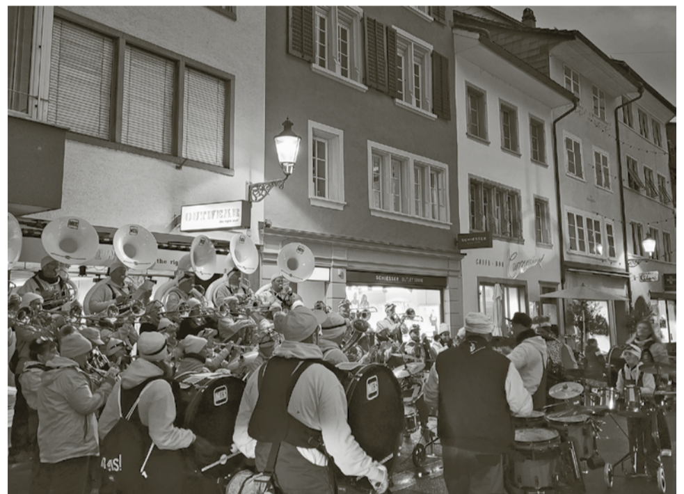
Fasnachteröffnung im November