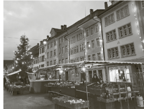
Wochenmarkt vor Weihnachten