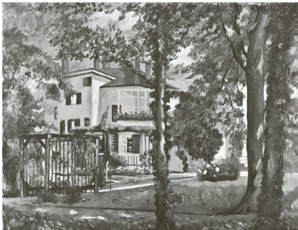
Bild: Henri Charles Manguin | La Villa Flora, 1912 | Kunst Museum Winterthur

Die Vernissage der ersten Ausstellung «Bienvenue! Meisterwerke von Cézanne, van Gogh und Manet» findet am 22. März 2024 statt.